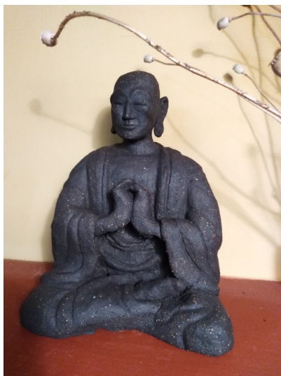
modeler un visage, un personnage